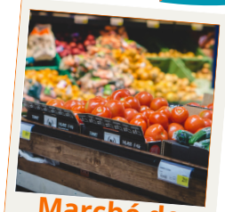
Marché de producteurs